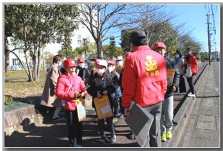
ストリートウォッチング ↑ →

の研究室が開発したアプリを活用し、大学生の協力のもとに、危険箇所を地図に表示する取り組みも行われ、テレビや新聞等でも報道されました。