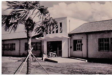
開校初年度の玄関風景