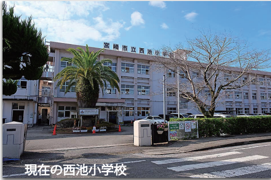
現在の西池小学校