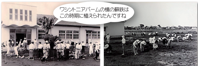
ワシントンニアパームの横の蘇鉄はこの時期に植えられたんですね