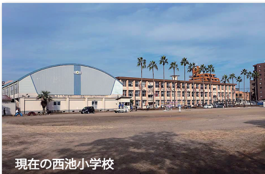
現在の西池小学校