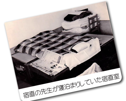
宿直の先生が寝泊まりしていた宿直室