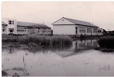
この後校庭として整備される西池の南側