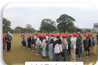
文化公園からスタート

さらに、各コース内の施設を訪問し防災に対する説明や地域のボランティアの方の地域情報を熱心に聞いていました。